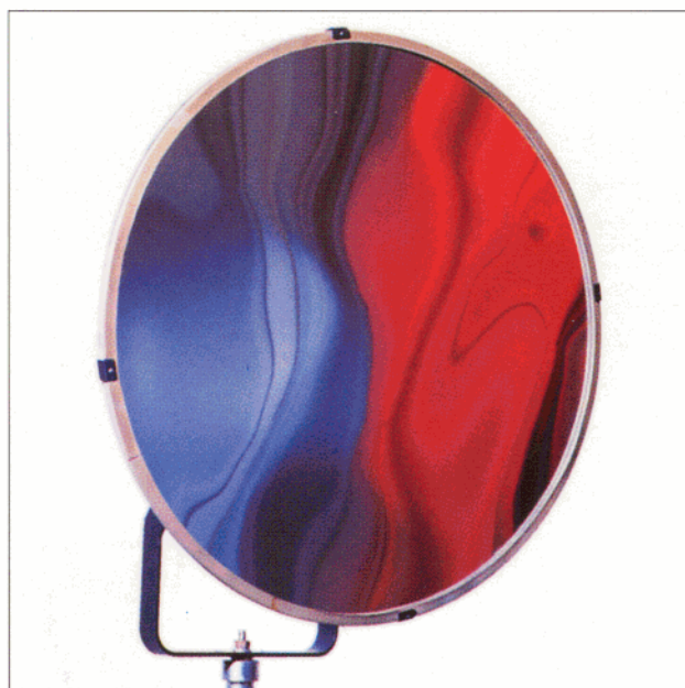
Rotationsspiegel Rotation Mirror